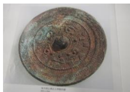
神獣形鏡 (しんじゅうけいきょう)

1909(明治42年)に現在の古知野東小学校建設の際に土盛りのために古墳の土を採ったところ下に示す神獣形鏡が出土した。直径14.9cmで、裏面にはネコ顔状の獣の模様がある。現在は、東京国立博物館に保管されている。